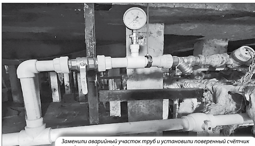
Заменяли аварийный участок труб и установили поверенный счётчик холодного водоснабжения на Космонавтов, 10.