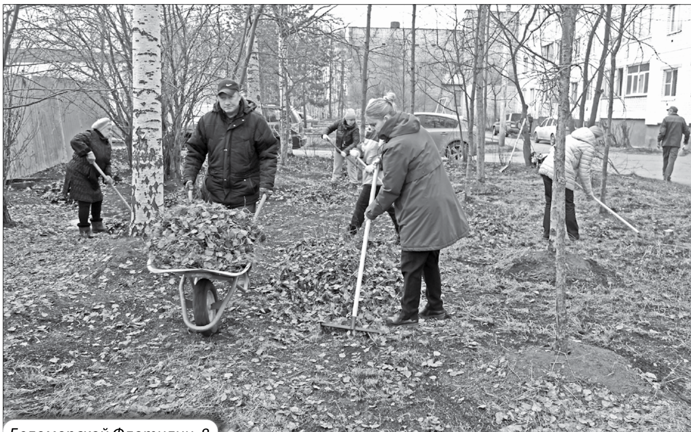
Беломорской Флотилии, 8

Уборка придомовых территорий от скопившегося за зиму мусора – традиция каждой весны. С преображением природы обновление приходит и во дворы: вместе с жителями сотрудники