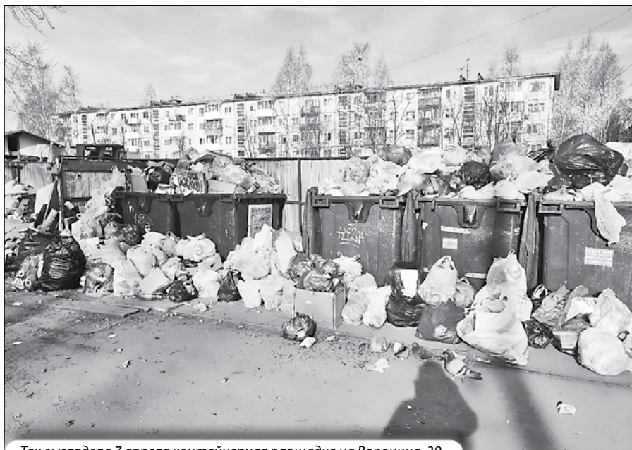
Так выглядела 7 апреля контейнерная площадка на Воронина, 39.

Кол-центр «ЭкоИнтегратора» работает ежедневно с 9.00 до 21.00.