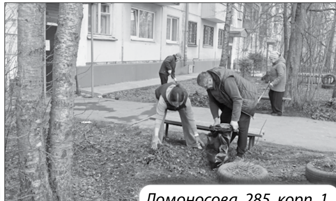
Ломоносова, 285, корп. 1

Одними из первых на субботник вышли жители Беломорской Флотилии, 8 (РСК «Метелица+») . Дружно раскидали не успевшую растаять гору снега, собрали сухую листву и мусор, подстригли разросшиеся под окнами дома кустарники. Активисты уже начали облагораживать свои клумбы и палисадники, так что с приходом лета во дворе распустятся цветы.