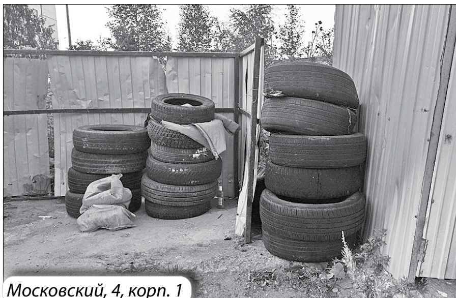
Московский, 4, корп. 1

С 2021 года в России запретили использовать автомобильные покрышки во дворах и на газонах для создания различных скульптур и ограждений.