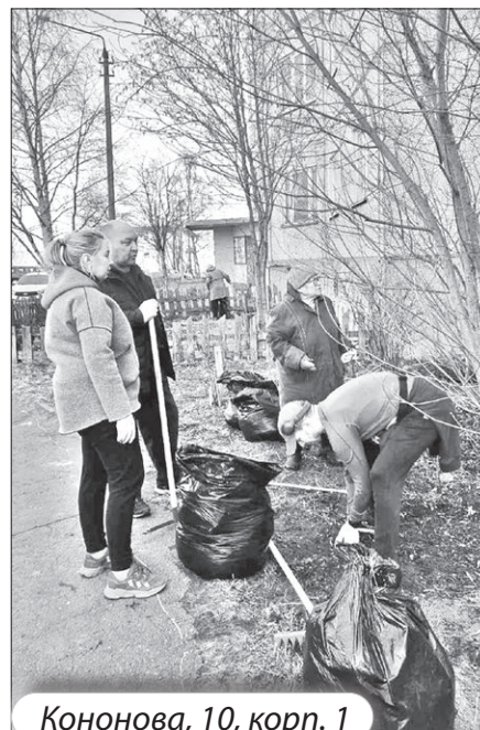
Кононова, 10, корп. 1