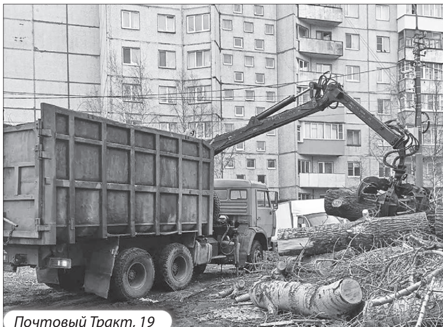
Почтовый Тракт, 19