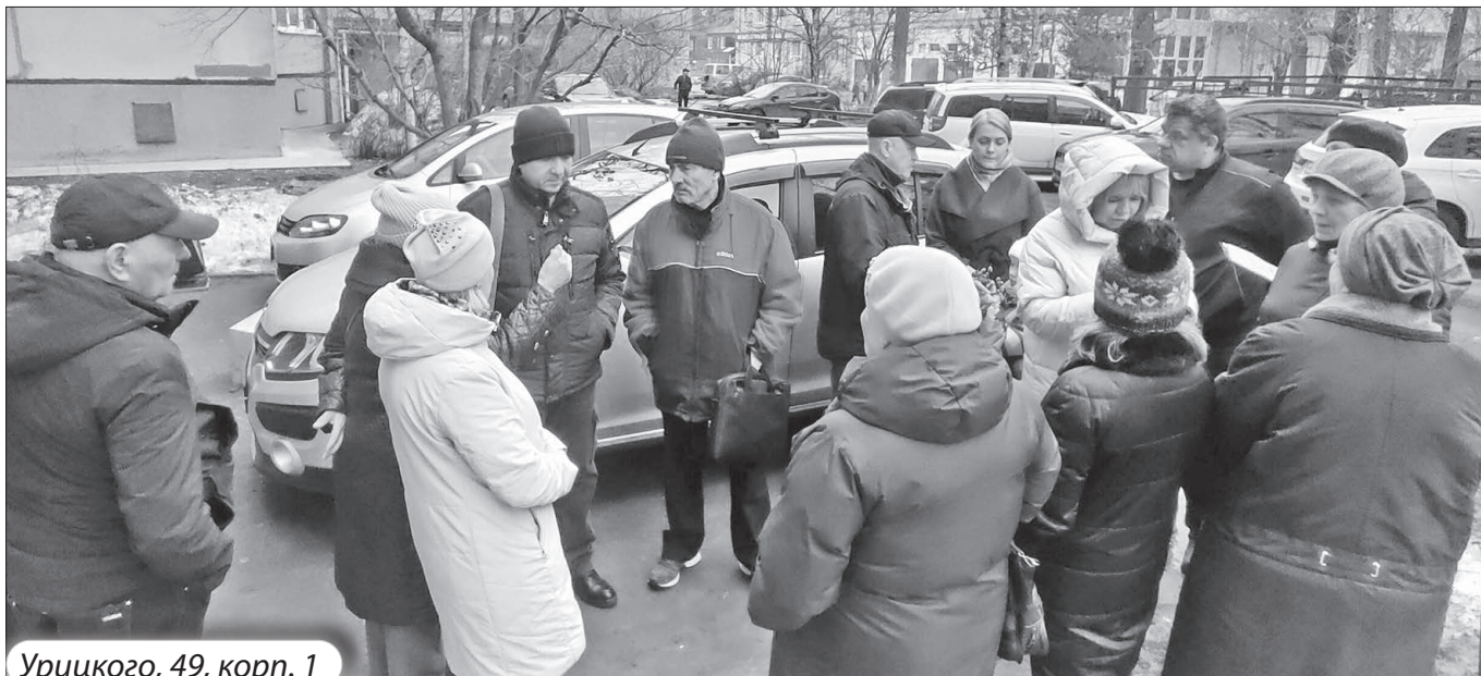
Урицкого, 49, корп. 1

входов в подъезды и лифтовых кабин, старые оконные рамы заменены на стеклопакеты».