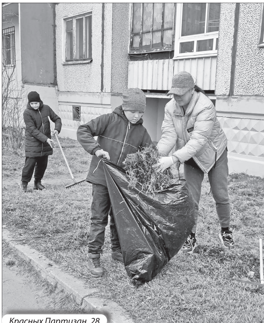
Красных Партизан, 28

Весело и энергично прошли традиционные субботники во дворах многоквартирных домов. Жители совместно с работниками управляющих компаний СРО «Гарант» собирали мусор и сухую траву, обрезали кустарники и обустроивали цветники под окнами. Отрадно, что в этом году активное участие в уборке придомовых территорий принимали дети. Вооружившись граблями и мешками, они с удовольствием трудились наравне со взрослыми. Во многих дворах на субботники выходили целыми семьями!