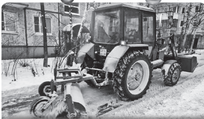
Во дворах домов, находящихся в обслуживании ООО «Результат», регулярно проводится механизированная уборка.