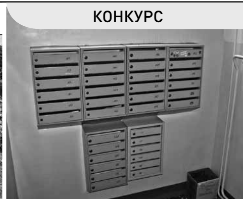
Претендент на звание лучшего – подъезд №5 на Новгородском, 41.