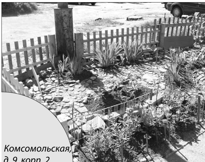
Комсомольская, д. 9, корп. 2

Все компании, входящие в СРО «Гарант», с готовностью поддержат инициативы собственников по благоустройству дворов. Дерзайте, придумывайте, воплощайте, и пусть ваш дворик станет самым красивым в Архангельске!