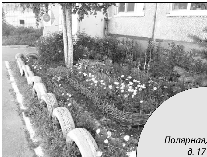
Полярная, д. 17