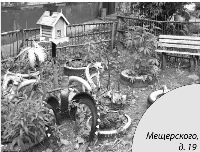
Мещерского, д. 19