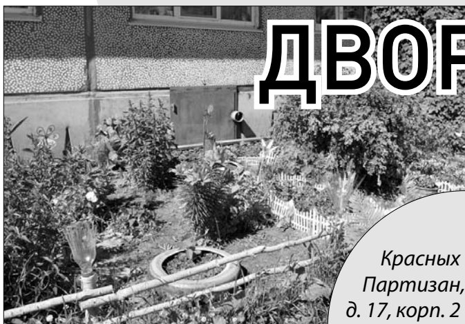
Красных Партизан, д. 17, корп. 2