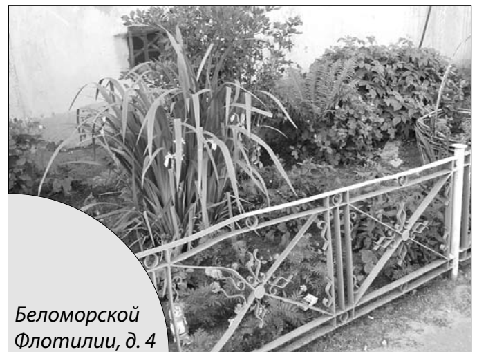
Беломорской Флотилии, д. 4