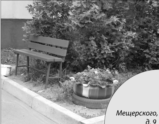
Мещерского, д. 9

Многие конкурсанты уже хорошо известны нашим читателям. Их дворники – настоящее произведение искусства. Ранней весной активисты начинают выращивать рассаду, чтобы потом наслаждаться буйством красок под собственными окнами. Радует, что год от года жильцы придумывают что-то новенькое, создают оригинальные инсталляции из подручных материалов, а кто-то воссоздает даже фрагменты сказок! На Советской, 17, к. 2, к примеру, под окошками с комфортом расположились Дед с Бабой и их курочка Ряба. А на Красных Партизан, 17, к. 2 ребят в травке поджидают крокодил Гена и Чебурашка.