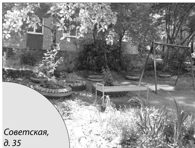
Советская, д. 35