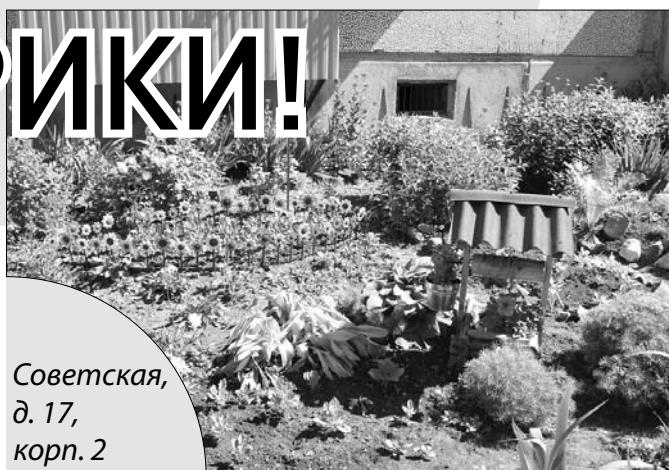
Советская, д. 17, корп. 2