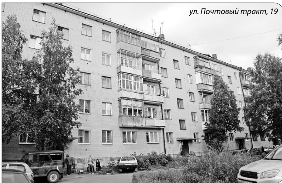
ул. Почтовый тракт, 19

кв. 7 – 14 972 руб. кв. 16 – 41 630 руб. кв. 46 – 63 437 руб. кв. 66 – 29 629 руб. кв. 94 – 77 794 руб.