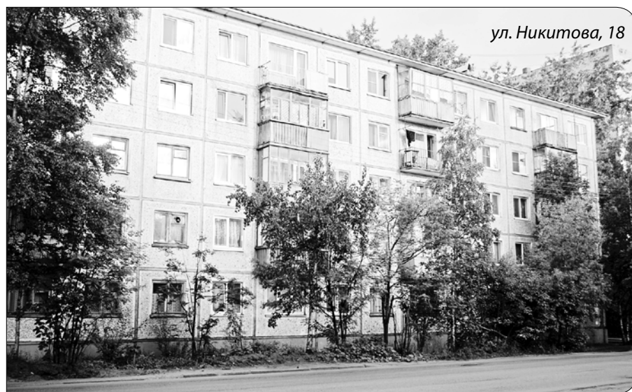
ул. Никитова, 18

ул. Никитова, 18 ООО «Управдом Варавино» Общий долг дома: 275 тыс. 117 руб.