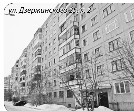
ул. Дзержинского 25, к. 2

ул. Воскресенская, 108 ООО «Городская управляющая компания-1» Общий долг дома: 397 тыс. 268 руб.