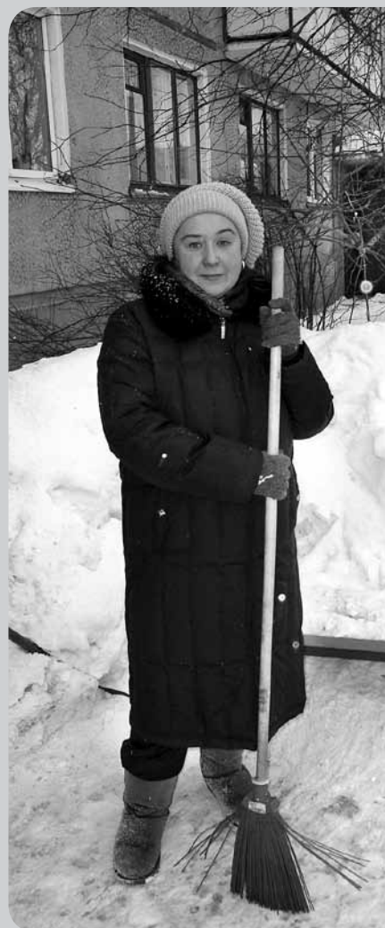
Время рушить стереотипы: дворник не всегда мужская профессия

«Кстати, зарплата дворника меня тоже вполне устраивает, – говорит она. – За несколько часов труда я получаю немногим меньше, чем за полный рабочий день в поликлинике. А в свободное время преподаю в детской школе раннего развития».