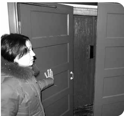
В 2011 году в многоэтажке будет проведен косметический ремонт всех подъездов. В двух крайних подъездах работа уже началась: установлены межтамбурные двери.

К сожалению, в большинстве домов округа Варавино-Фактории тарифы на оказание жилищных услуг остаются мизерными – на уровне 2006 года. В пятиэтажных – чуть выше 4 рублей, в девятиэтажных – около 7 рублей.