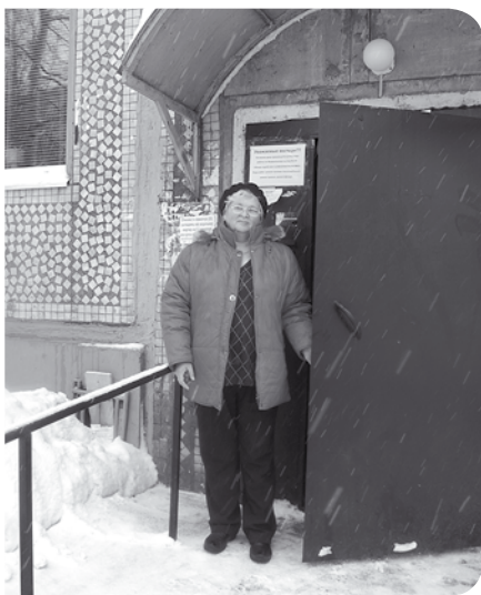
В 2010 году у каждого крыльца были установлены железные перила.

щедомовое энергопотребление с квадратного метра. Вот и посчитайте, сколько средств остается в распоряжении управляющей компании на содержание данной многоэтажки».