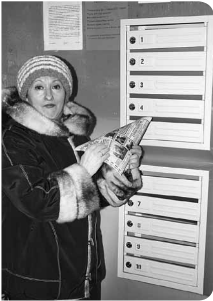
Жильцы дома понимают, что сегодня только от них самих зависит благоустройство их дома.

К сожалению, в большинстве домов округа Варавино-Фактории тарифы на оказание жилищных услуг остаются мизерными – на уровне 2006 года. В пятиэтажных – чуть выше 4 рублей, в девятиэтажных – около 7 рублей.