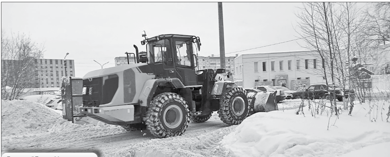
Почтовый Тракт, 30

Хочется призвать жителей Архангельска к внимательности, ведь порядок на придомовой территории – ответственность не только управляющей компании, но и каждого собственника.