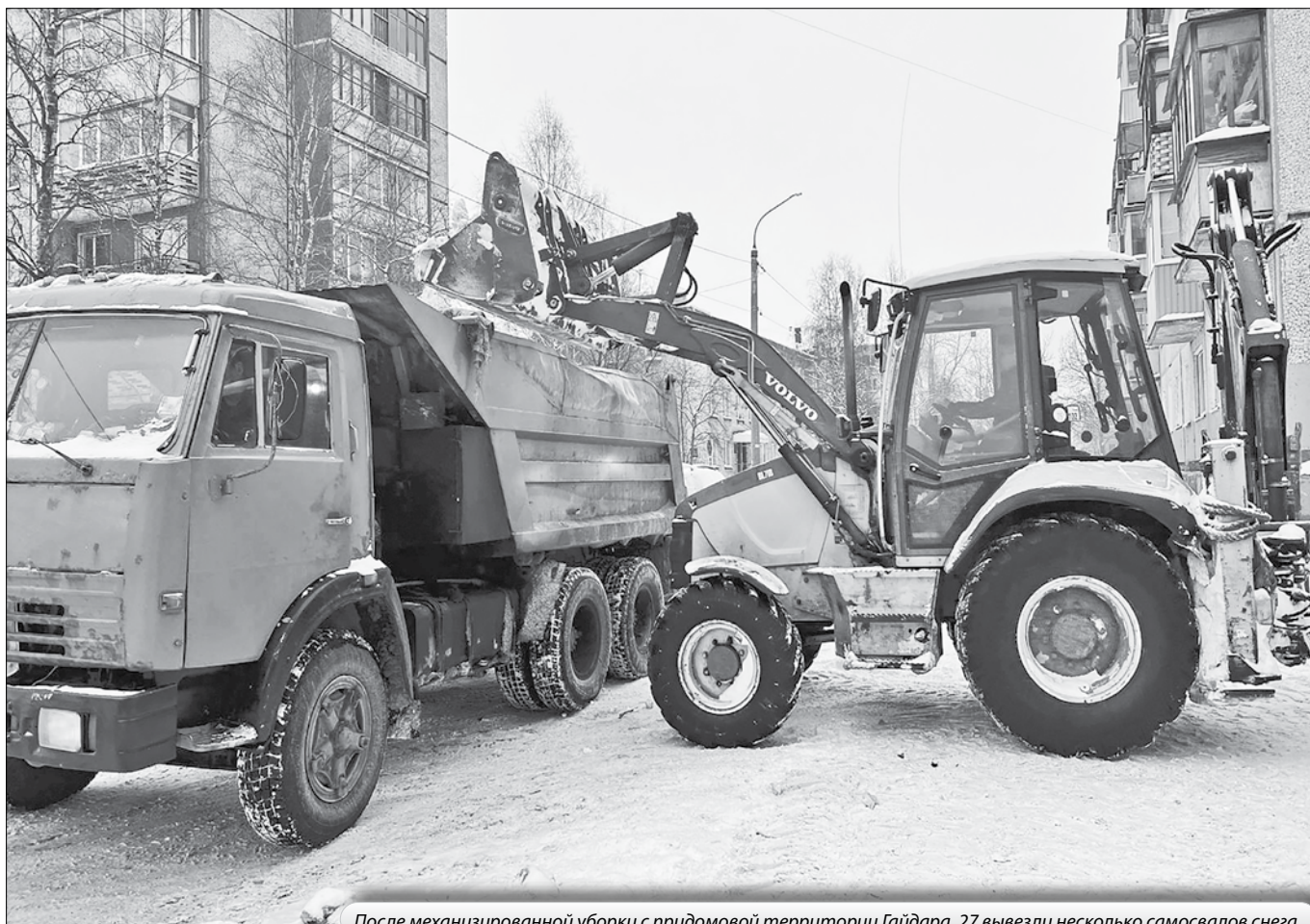
После механизированной уборки с придомовой территории Гайдара, 27 вывезли несколько самосвалов снега.

Работа по механизированной уборке дворовых территорий в управляющих компаниях НП «СРО УН «Гарант» идёт в штатном режиме. Снега этой зимой достаточно много, но техника справляется.