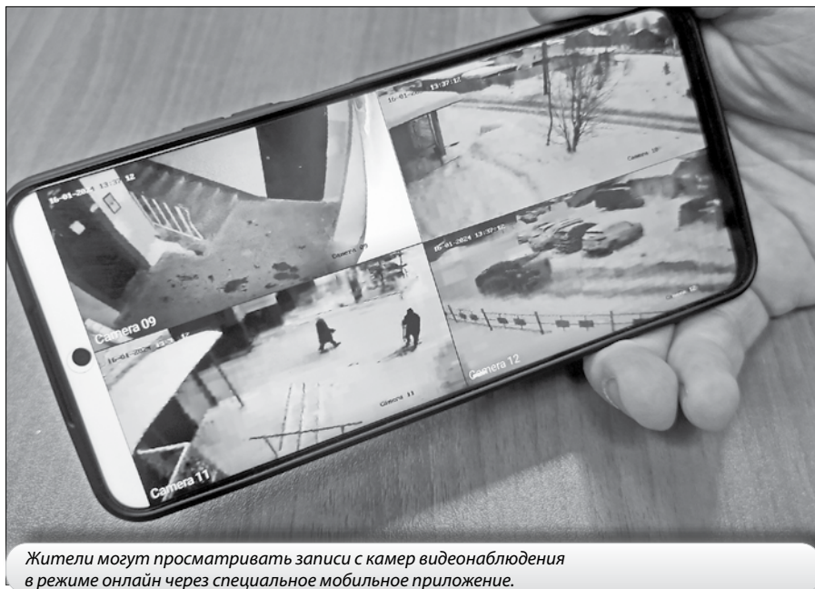
Жители могут просматривать записи с камер видеонаблюдения в режиме онлайн через специальное мобильное приложение.