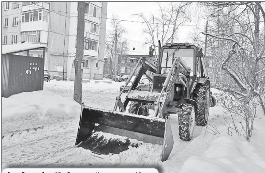
Розы Люксембург, 37 и Советских Космонавтов, 35

Наряду с уборкой дворов от снега, УК постоянно ведут работы по очистке кровель. Однако при смене температуры наружного воздуха сосульки и наледь на крышах могут образовываться довольно стремительно. Специалисты МЧС советуют горожанам соблюдать безопасность. Особое внимание следует уделить мерам защиты детей. Если во время движения по тротуару вы услышали наверху подозрительный шум – нельзя останавливаться, поднимать голову и рассматривать, что там случилось. Возможно, это сход снега или ледяной глыбы. Нужно как можно быстрее прижаться к стене – козырёк крыши послужит укрытием.