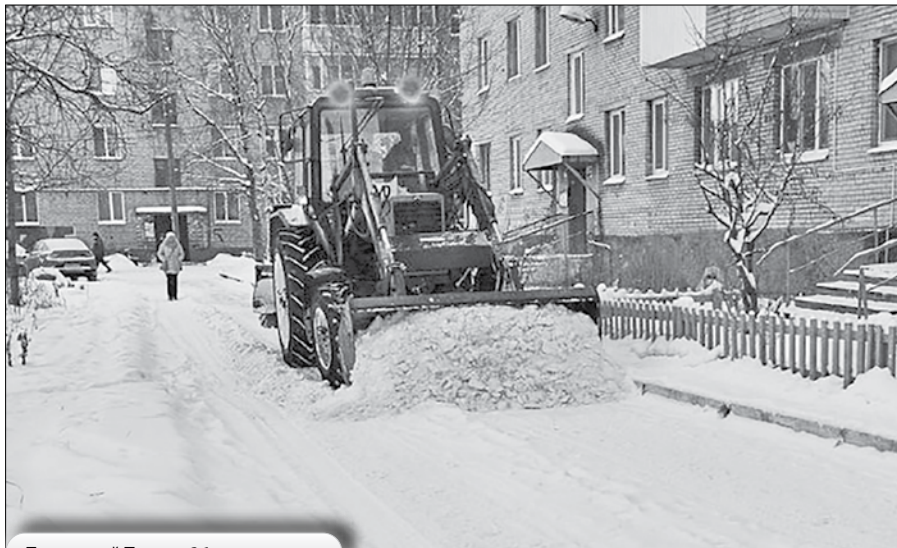
Почтовый Тракт, 26

Падение снега и наледи с крыш может привести к увечьям и даже к гибели. При обнаружении сосулек, висящих на крыше вашего дома, необходимо обратиться в Единую диспетчерскую службу управляющих организаций НП «СРО УН «Гарант» по номеру 495-000 .